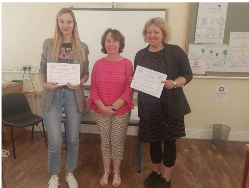
Sl. 55. Training for Ekonomska škola Požega: mobilnost u Irskoj (2022.)