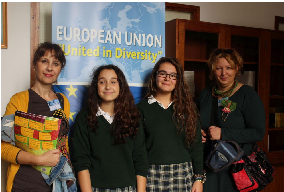
Sl. 15. Communication and Culture: transnacionalni sastanak u Španjolskoj (2015.)