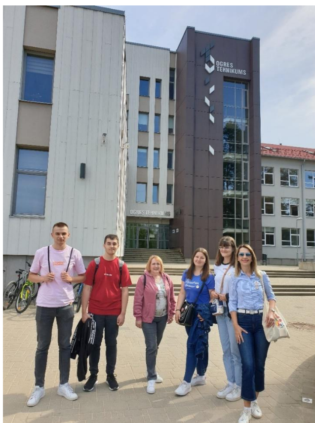
Sl. 54. YES: the Earth: mobilnost u Latviji (2022.)