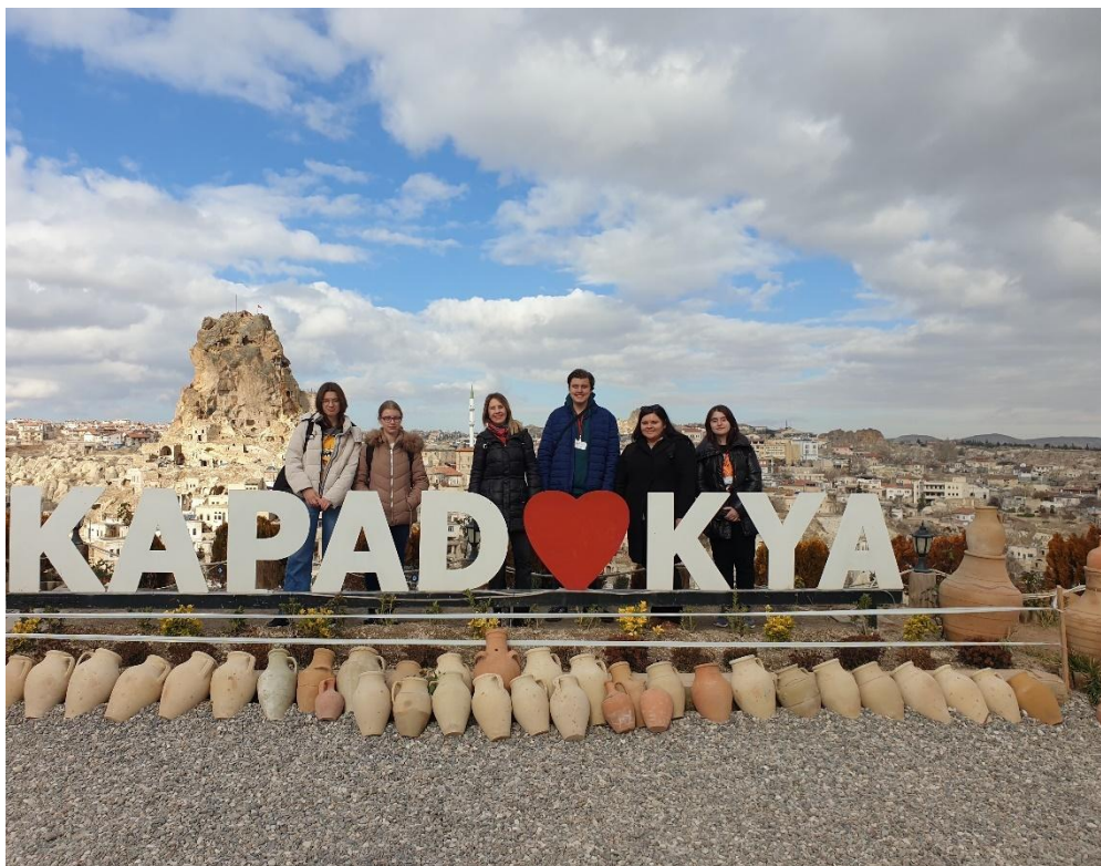
Sl. 57. DIGI-CUL: mobilnost u Turskoj (2022.)