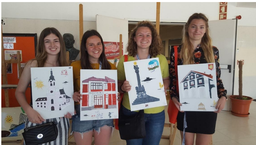
Sl. 39. My Culture – Your Culture – Our Culture: mobilnost u Portugalu (2019.)