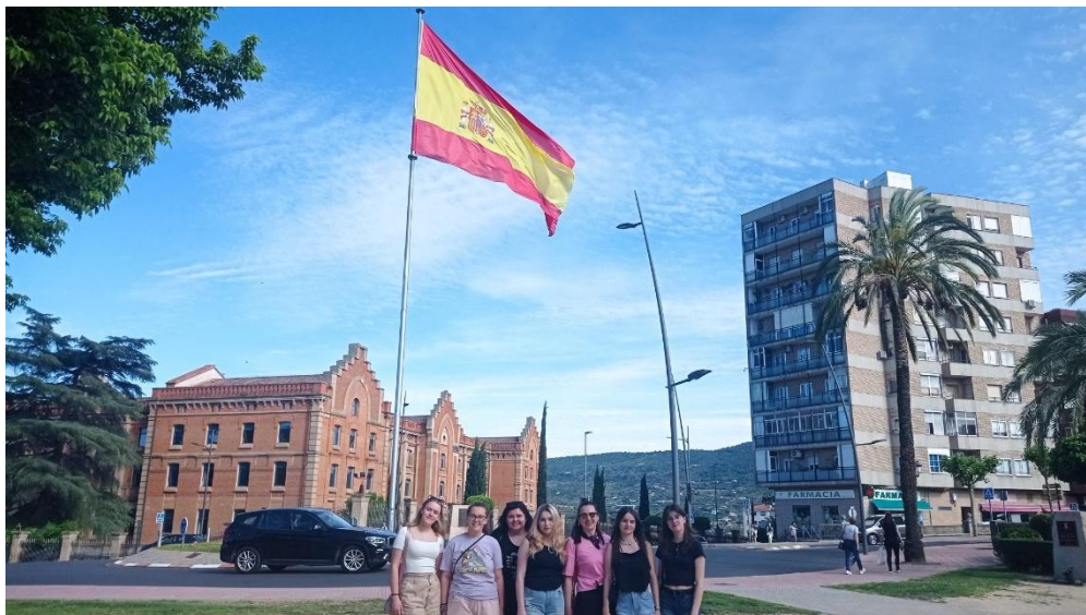
Sl. 63. EU Reporters: mobilnost u Španjolskoj (2023.)