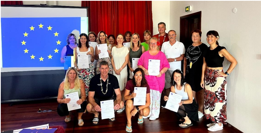
Sl. 66. EU Reporters: mobilnost u Francuskoj Polineziji (2023.)