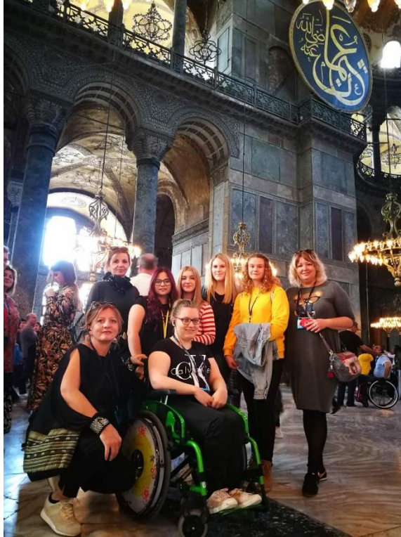
SI. 42. CHAPTER: mobilnost u Turskoj (2019.)