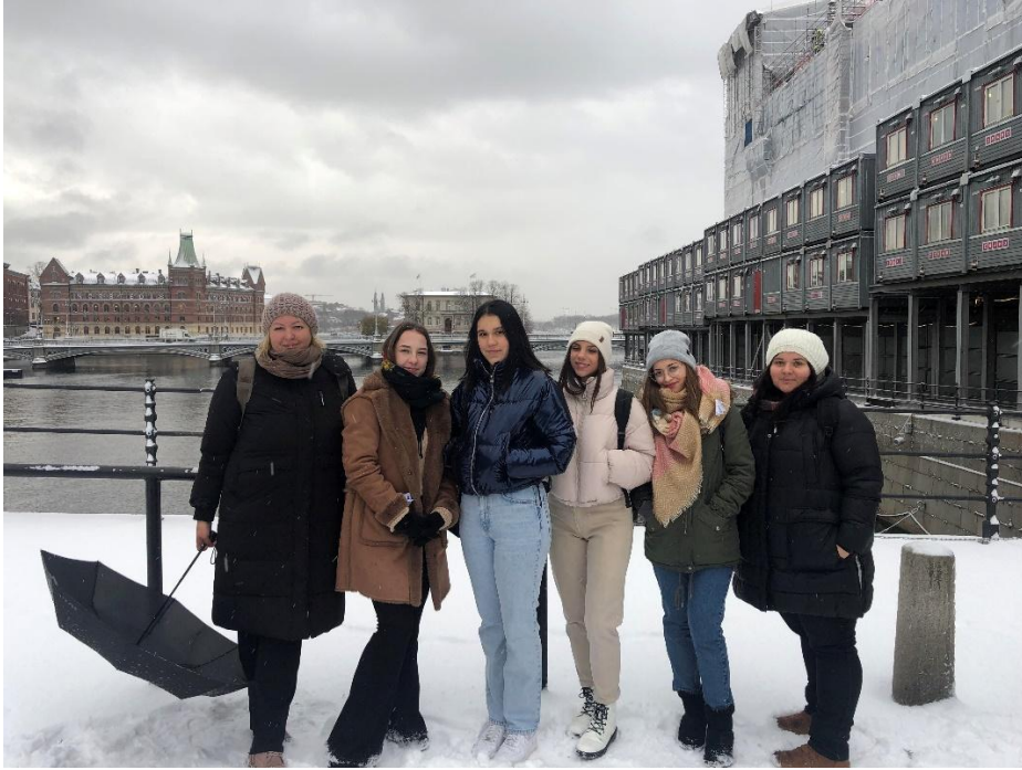
SI. 44. CHAPTER: mobilnost u Švedskoj (2021.)