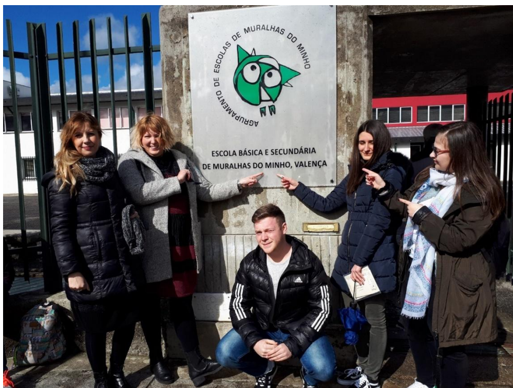
Sl. 27. BookPals©schools.eu: mobilnost u Portugalu (2018.)