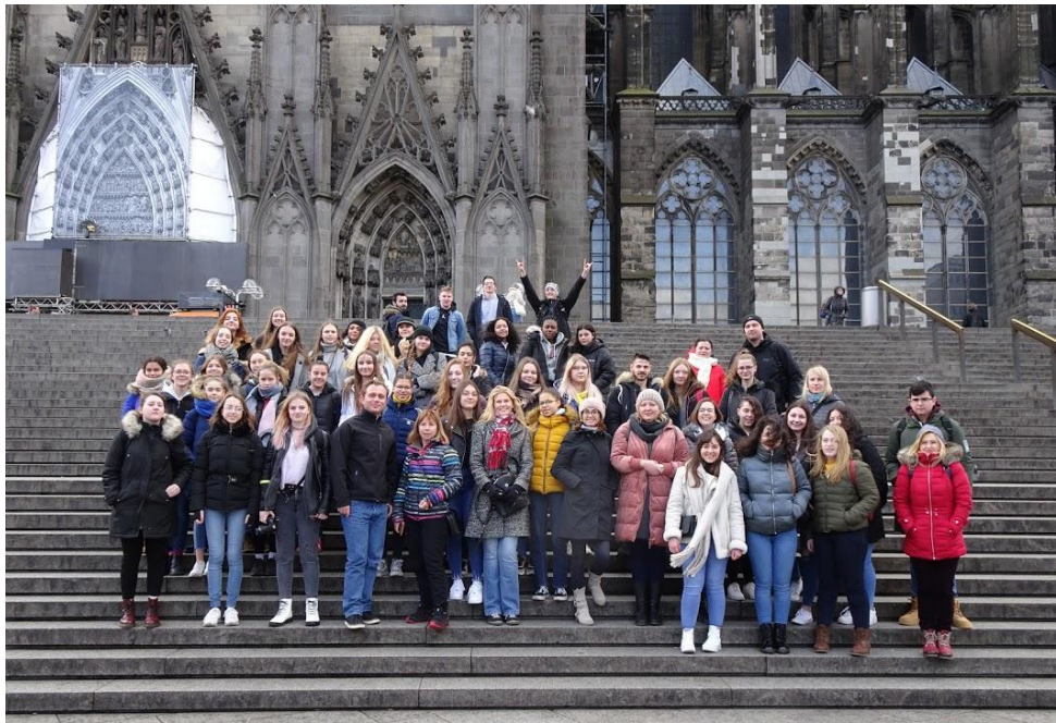
Sl. 47. ECHOSET: mobilnost u Njemačkoj (2020.)