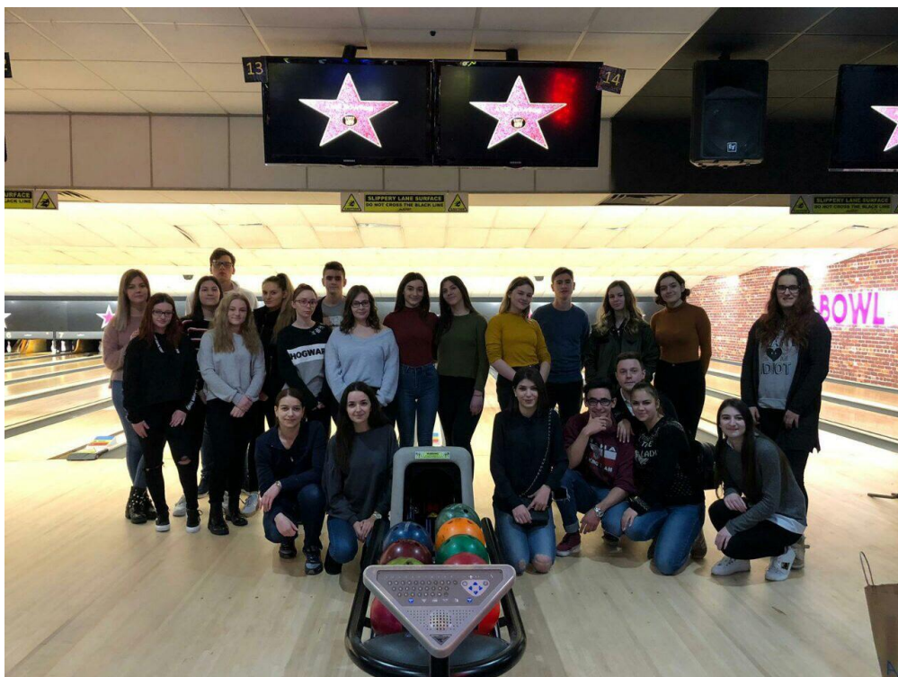
Sl. 33. Korak naprijed: sudionici prve mobilnosti u Engleskoj (2019.)