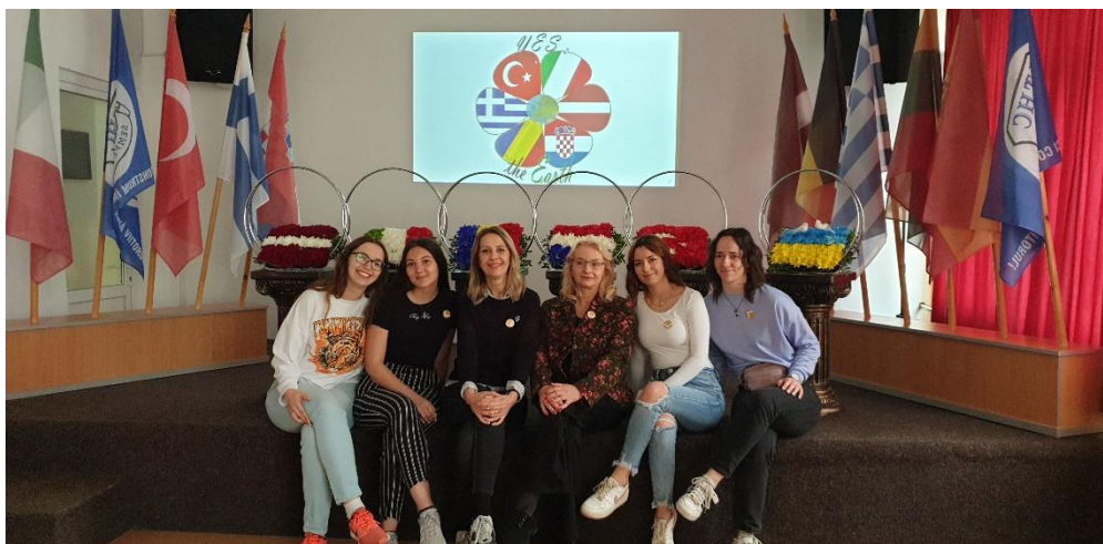
Sl. 53. YES: the Earth: mobilnost u Rumunjskoj (2022.)