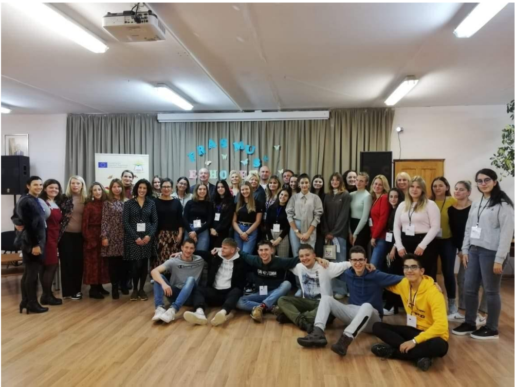
Sl. 49. ECHOSET: mobilnost u Litvi (2021.)