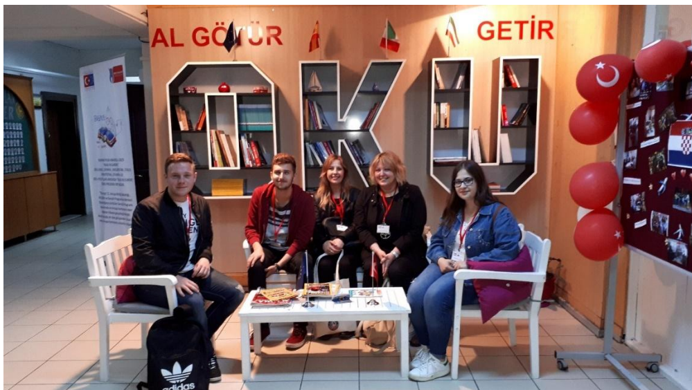
Sl. 28. BookPals©schools.eu: mobilnost u Turskoj (2018.)