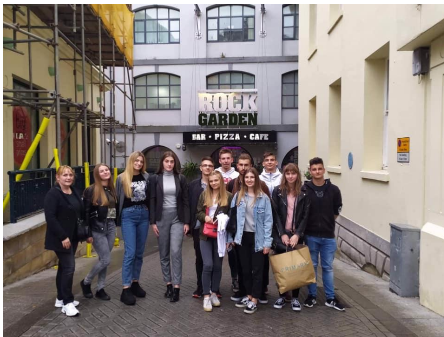
Sl. 36. Korak naprijed: sudionici druge mobilnosti u Engleskoj (2019.)