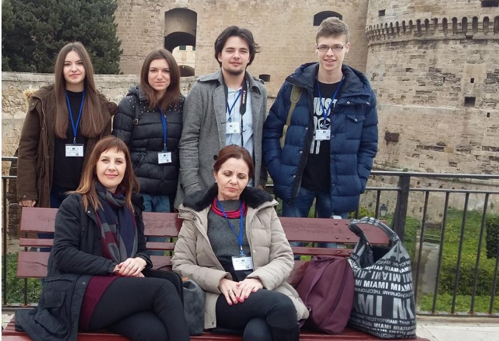
Sl. 17. Communication and Culture: mobilnost u Italiji (2016.)