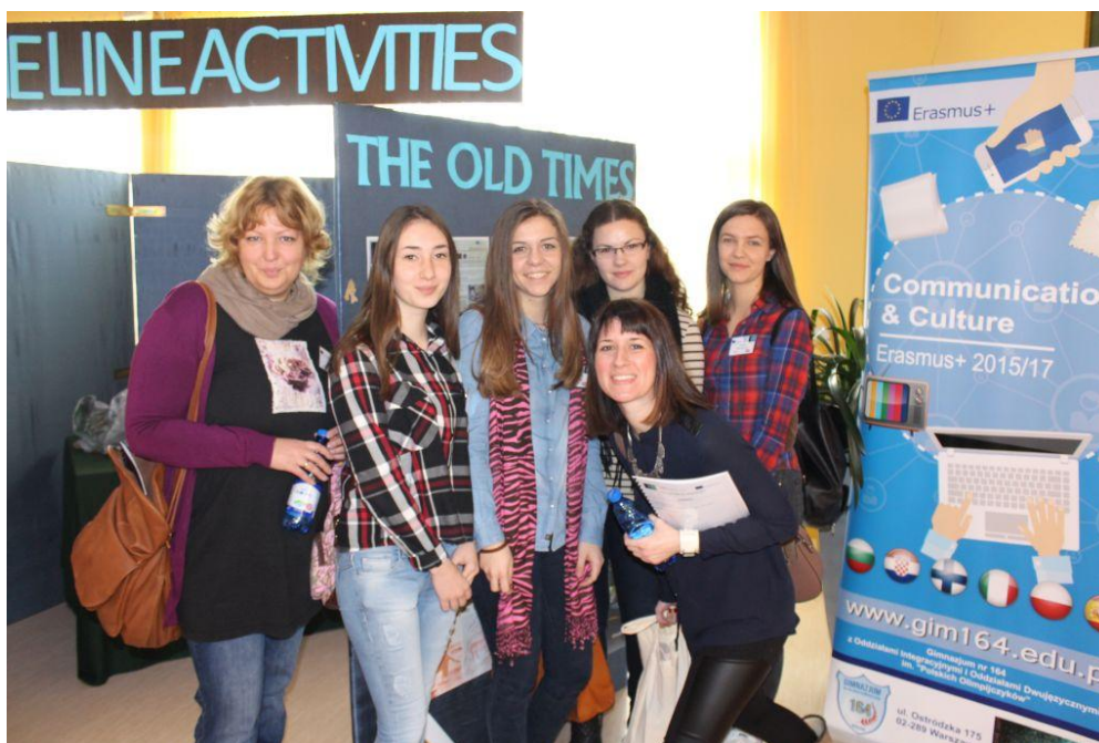
Sl. 16. Communication and Culture: mobilnost u Poljskoj (2015.)