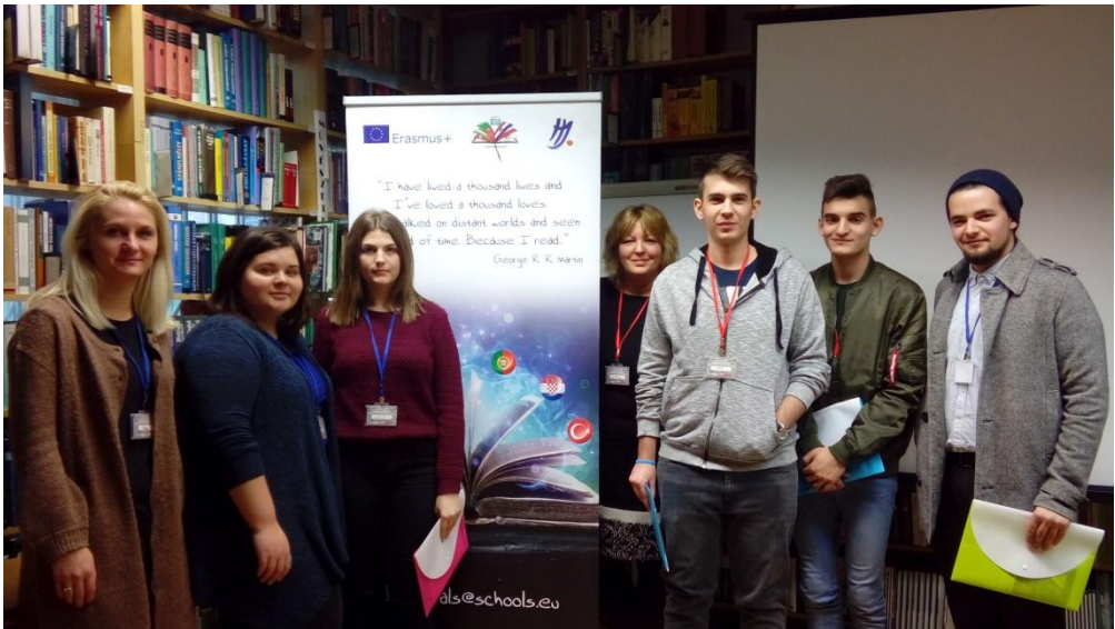
Sl. 23. BookPals@schools.eu: mobilnost u Mađarskoj (2016.)