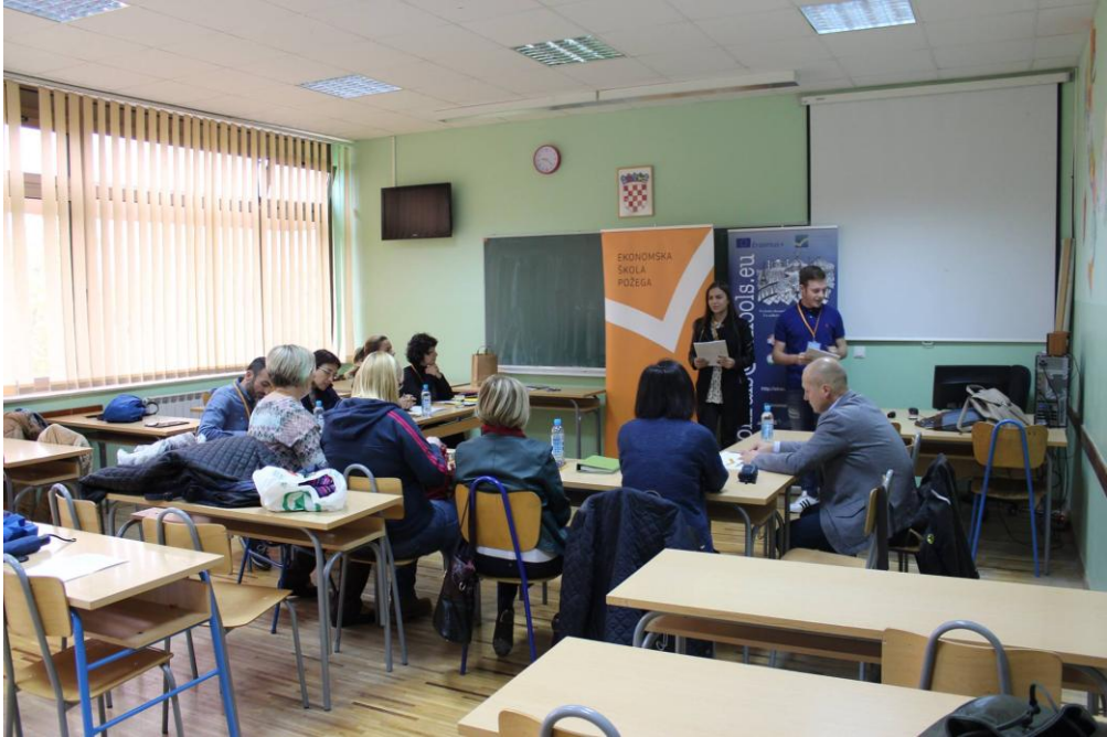
Sl. 22. BookPals@schools.eu: transnacionalni sastanak u Hrvatskoj (2016.)