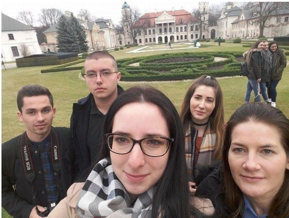
Sl. 24. BookPals@schools.eu: mobilnost u Poljskoj (2017.)