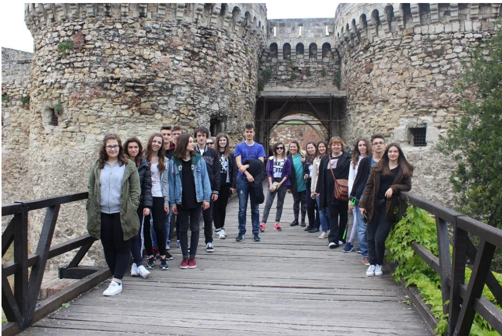
Sl. 18. Communication and Culture: mobilnost u Bugarskoj (2016.)