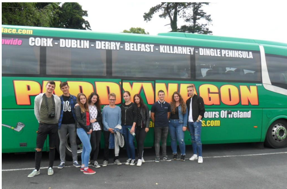
Sl. 31. Learning by Doing: učenci 3. h u Irskoj (2017.)