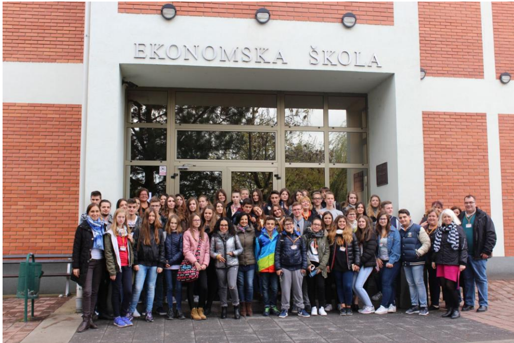
Sl. 19. Communication and Culture: mobilnost u Hrvatskoj (2016.)