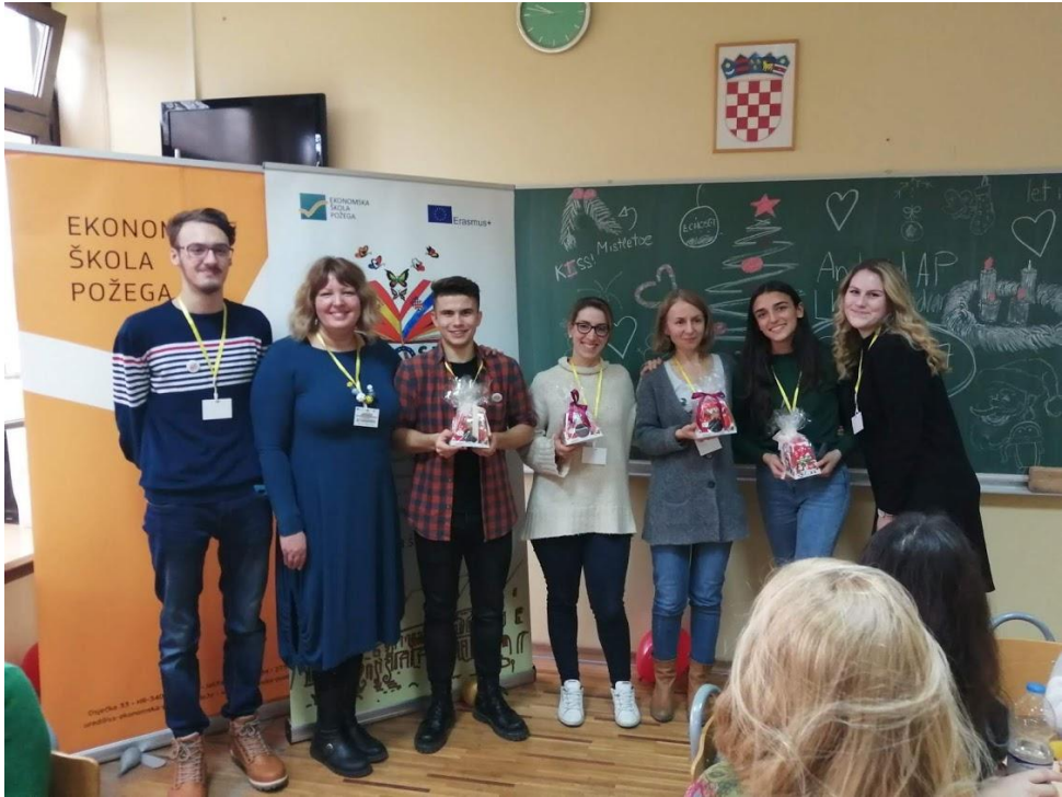
Sl. 46. ECHOSET: mobilnost u Hrvatskoj (2020.)