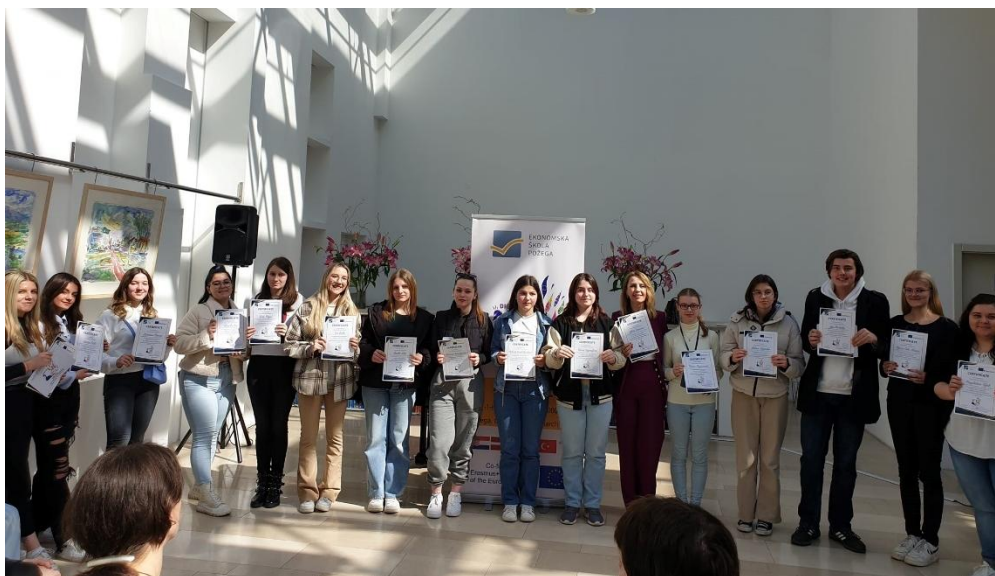
Sl. 58. DIGI-CUL: mobilnost u Hrvatskoj (2023.)