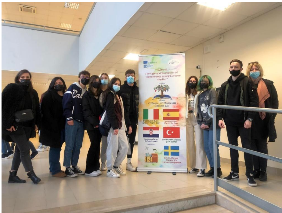
SI. 45. CHAPTER: mobilnost u Italiji (2022.)