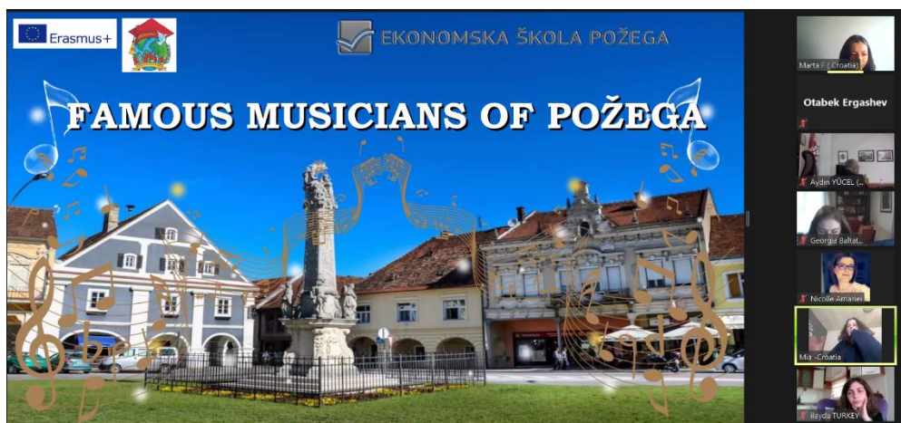
Sl. 40. My Culture – Your Culture – Our Culture: virtualna mobilnost u Rumunjskoj (2021.)