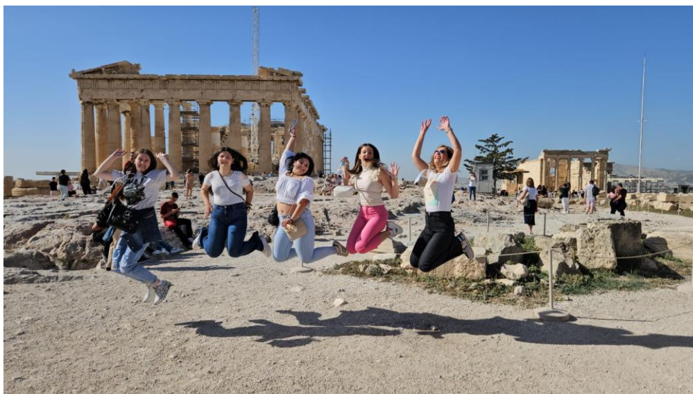
Sl. 59. DIGI-CUL: mobilnost u Grčkoj (2023.)