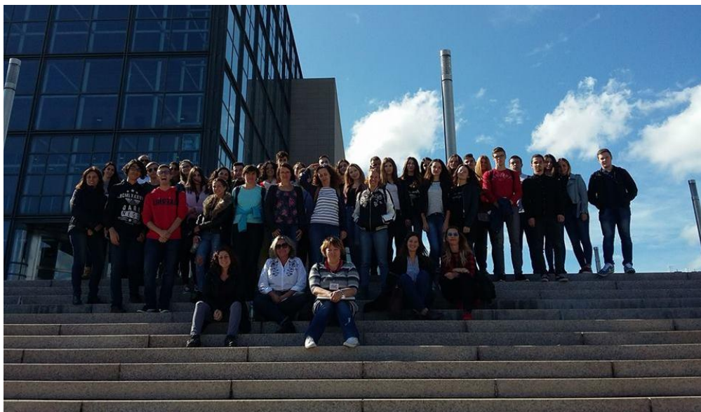
Sl. 26. BookPals©schools.eu: mobilnost u Hrvatskoj (2017.)