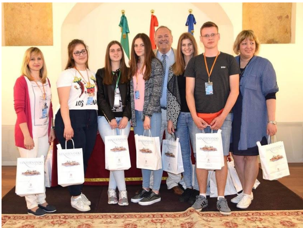
Sl. 21. Communication and Culture: mobilnost u Španjolskoj (2017.)