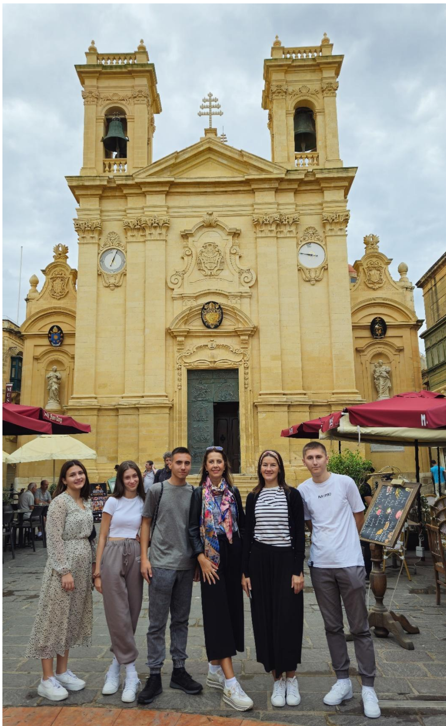
Sl. 61. DIGI-CUL: mobilnost na Malti (2024.)