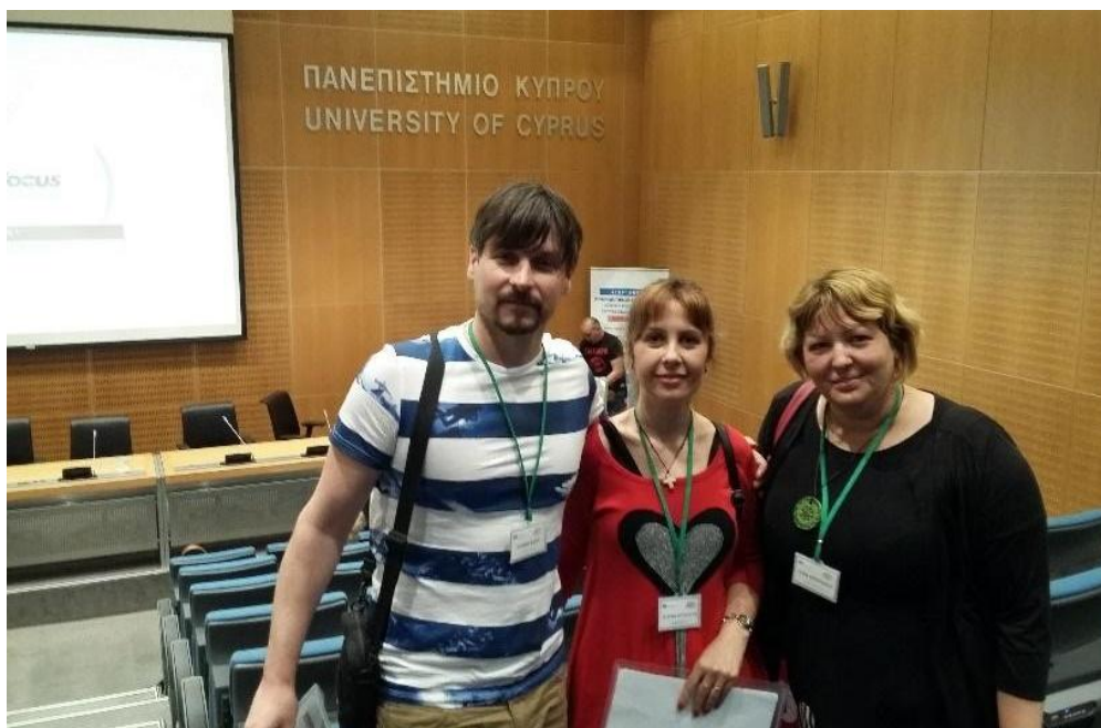
Sl. 25. BookPals@schools.eu: mobilnost na Cipru (2017.)