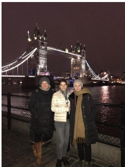
Sl. 34. Korak naprijed: sudionici prve mobilnosti u Engleskoj (2019.)