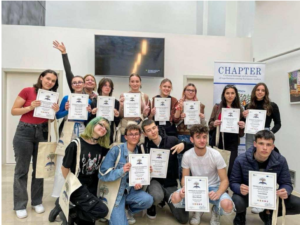
Sl. 46. Sudionici projekta CHAPTER