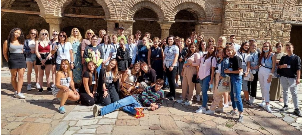
Sl. 48. ECHOSET: mobilnost u Makedoniji (2021.)