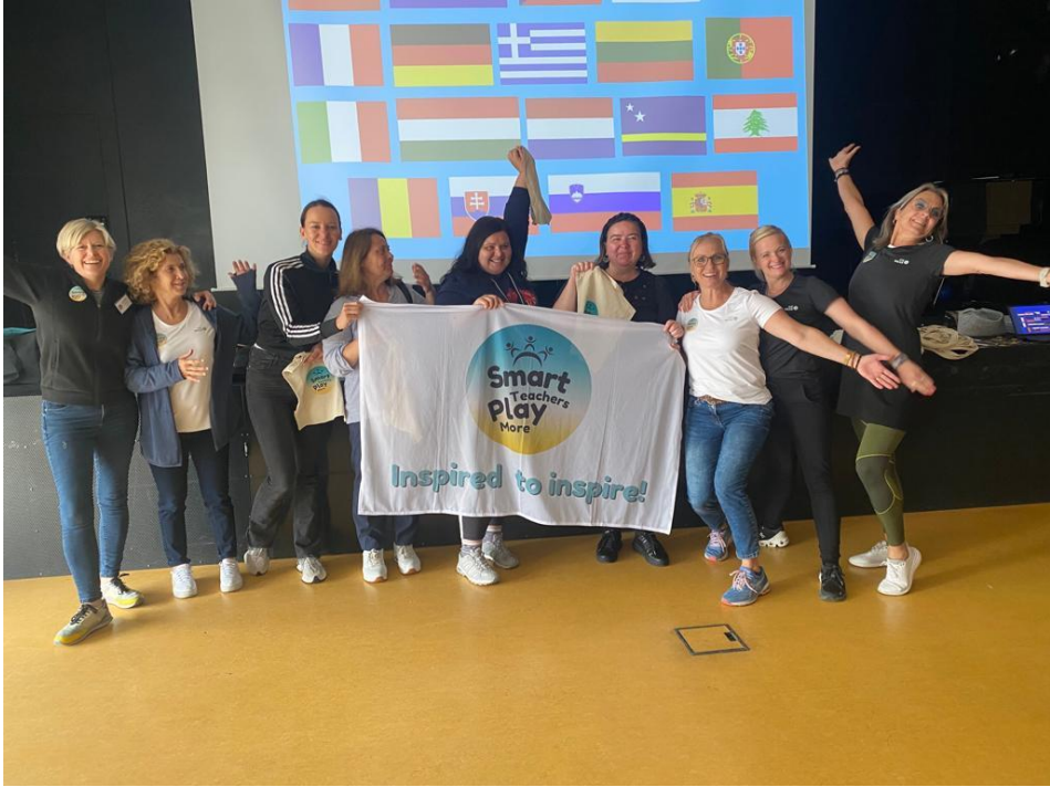
Sl. 67. EU Reporters: mobilnost na Islandu (2023.)