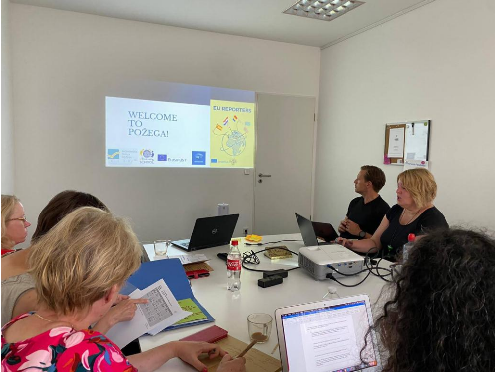
Sl. 65. EU Reporters: mobilnost u Njemačkoj (2023.)