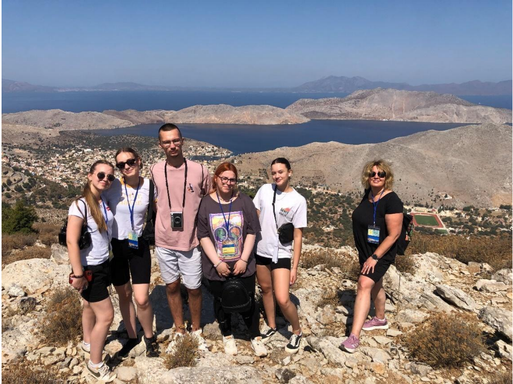
Sl. 69. EU Reporters: mobilnost u Grčkoj ( 2023.)