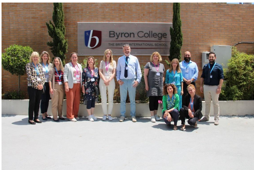
Sl. 64. EU Repoters: mobilnost u Grčkoj (2023.)