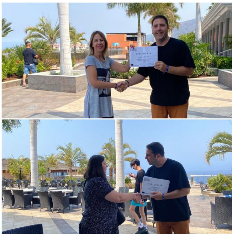
Sl. 56. Training for Ekonomska škola Požega: mobilnost na Tenerifima (2022.)