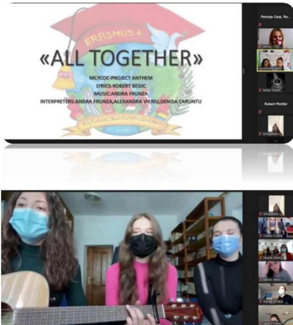
SI. 41. My Culture – Your Culture – Our Culture: virtualna mobilnost u Turskoj (2021.)