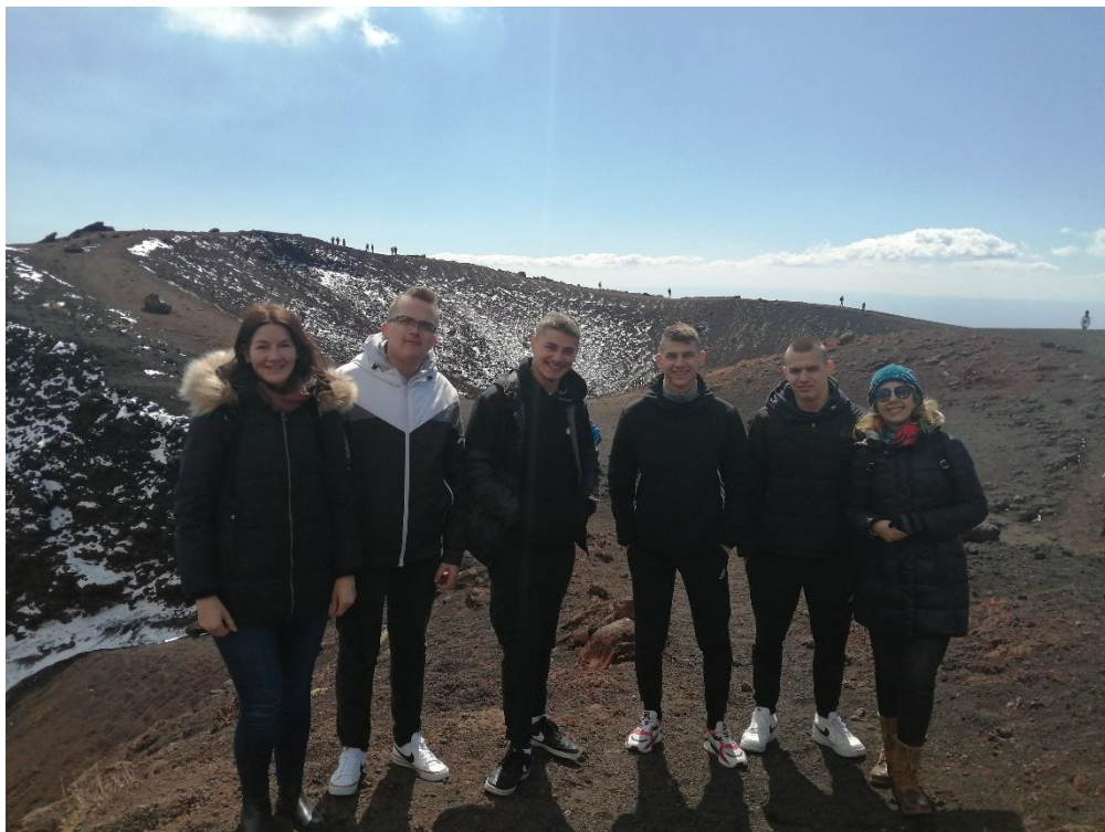
Sl. 52. YES: the Earth: mobilnost u Italiji (2022.)