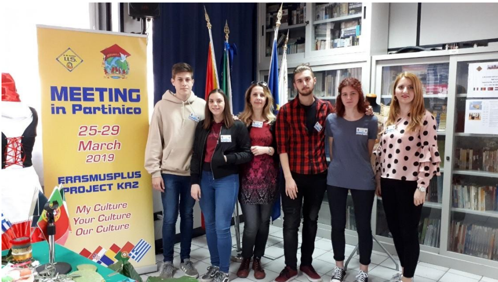
SI. 38. My Culture – Your Culture – Our Culture: mobilnost na Siciliji (2019.)