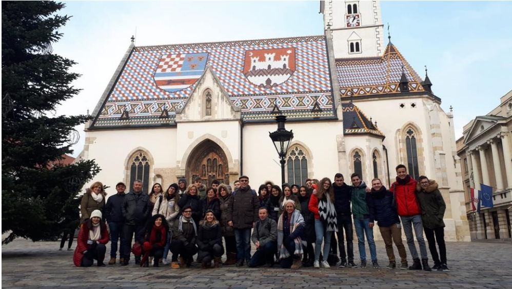
SI. 37. My Culture – Your Culture – Our Culture: prva mobilnost u Hrvatskoj (2018.)