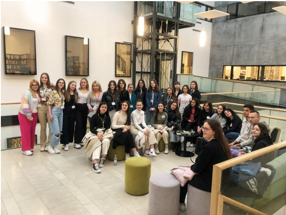
Sl. 62. EU Reporters: mobilnost u Hrvatskoj (2023.)

Akreditacijom će se pospješiti strategija internacionalizacije škole, omogućiti daljnji napredak u digitalizaciji škole, osuvremeniti metodologija rada redovnih i fakultativnih predmeta te izvannastavnih aktivnosti u svrhu dodatne motivacije učenika, pospješiti komunikacija u nastavnom procesu, otežana nakon pandemijskih uvjeta, osvijestiti pripadnost europskom građanstvu te pružiti adekvatna potpora za mentalnu, emocionalnu, fizičku i socijalnu dobrobit učenika.