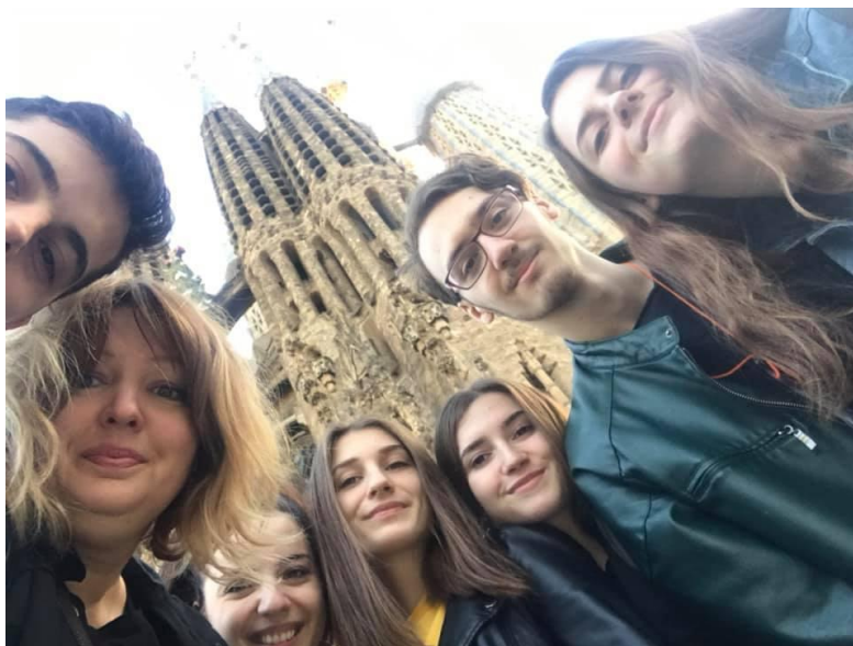
SI. 43. CHAPTER: mobilnost u Španjolskoj (2020.)