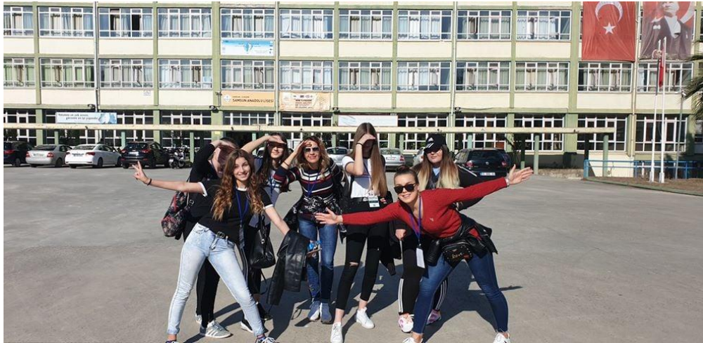
Sl. 51. YES: the Earth: mobilnost u Turskoj (2019.)