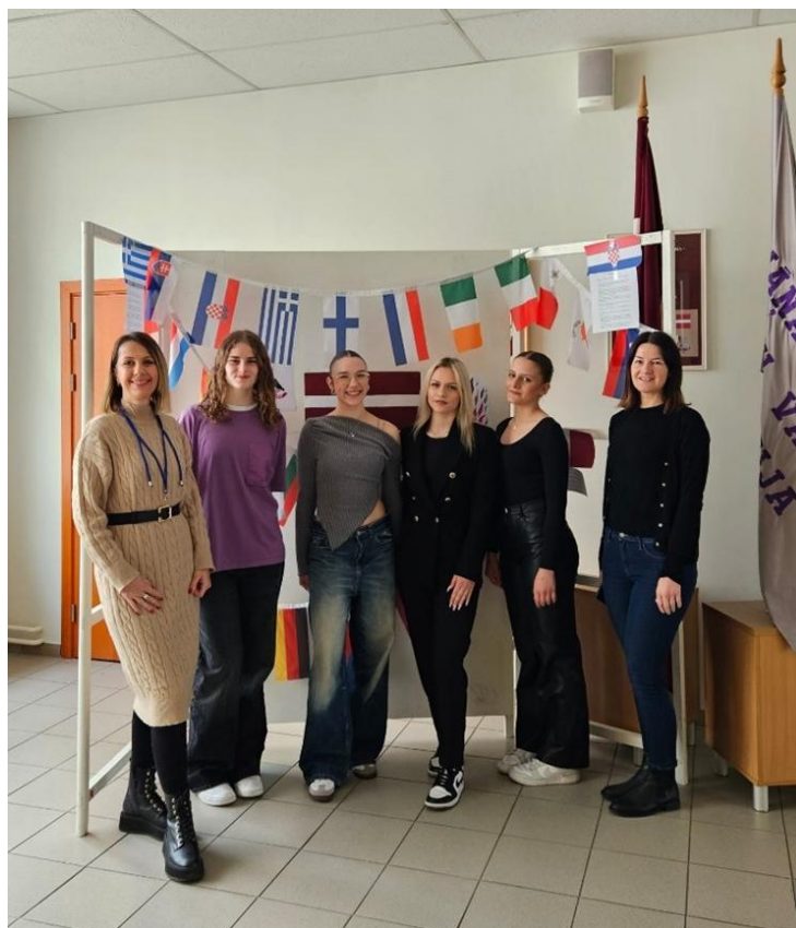
Sl. 60. DIGI-CUL: mobilnost u Latviji (2024.)