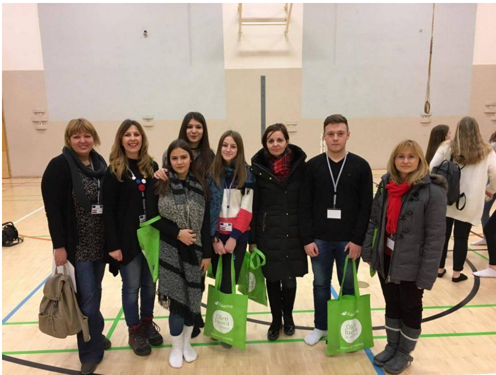
Sl. 20. Communication and Culture: mobilnost u Finskoj (2017.)