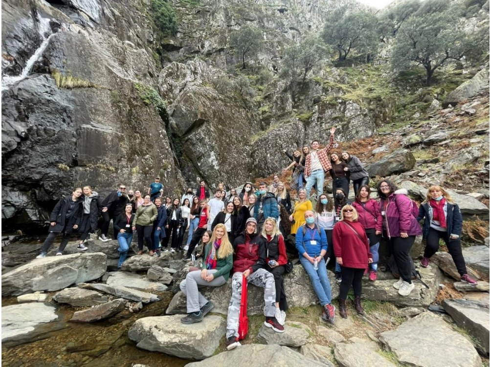
Sl. 50. ECHOSET: mobilnost u Španjolskoj (2022.)