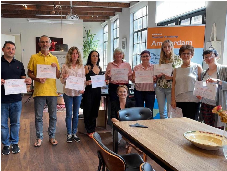
Sl. 68. EU Reporters: mobilnost u Nizozemskoj (2023.)