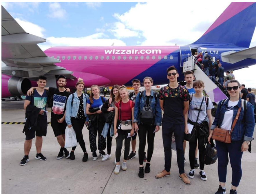
Sl. 35. Korak naprijed: sudionici druge mobilnosti u Engleskoj (2019.)